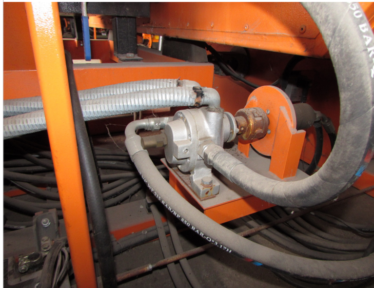
IMG_2692 - osprzet hydrauliczny