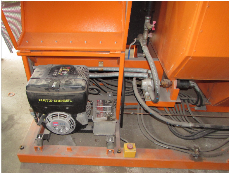
IMG_2727 - silnik i osprzet hydrauliczny