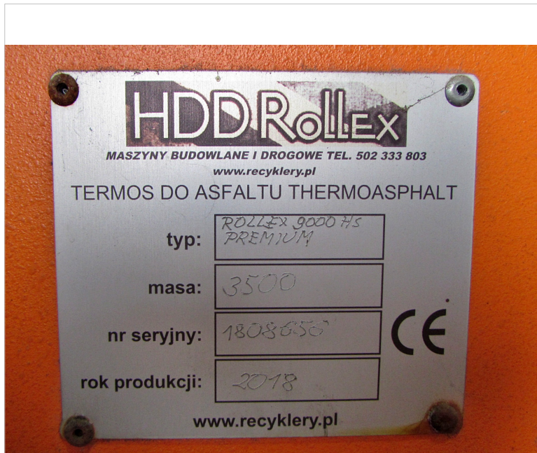
IMG_2656 - widok tablicy znamionowej