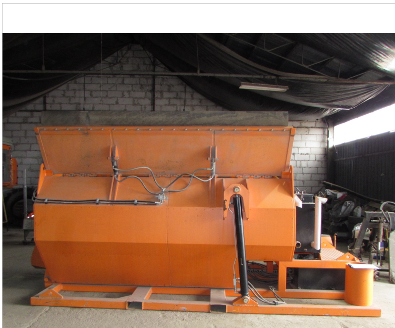
IMG_2657 - ogólny widok termosu