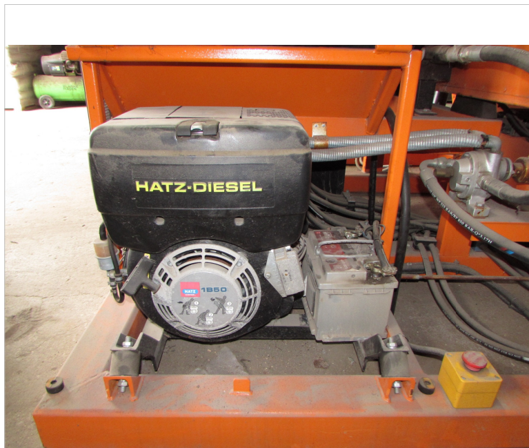
IMG_2690 - silnik spalinowy z osprzętem