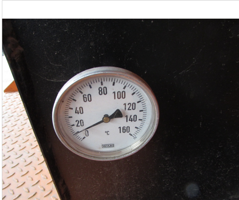
IMG_2753 - wskaźnik temperatury