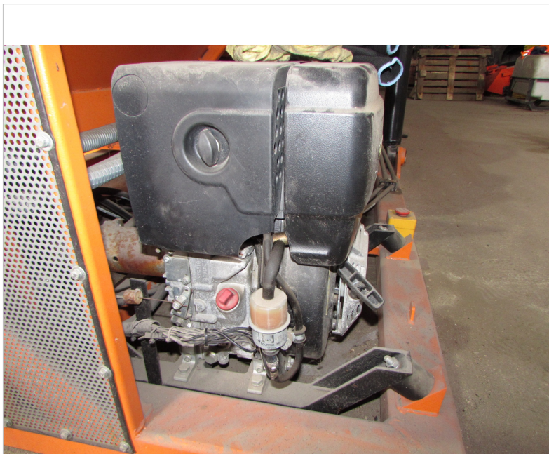
IMG_2710 - silnik spalinowy z osprzętem