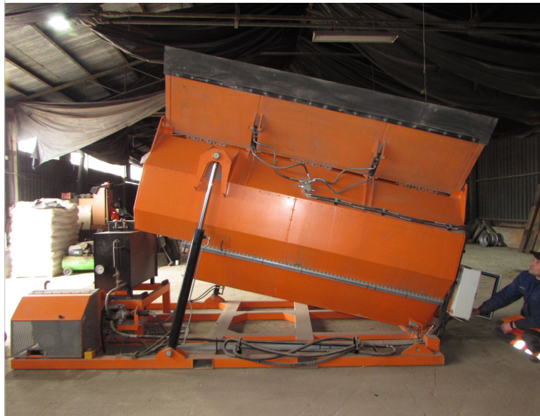
IMG_2678 - stan częściowego odchylenia kapsuły