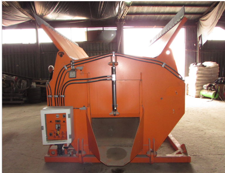
IMG_2664 - ogólny widok termosu