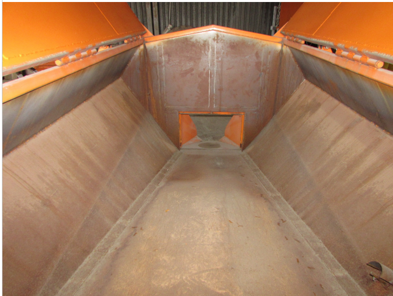
IMG_2655 - widok wnętrza kapsuły