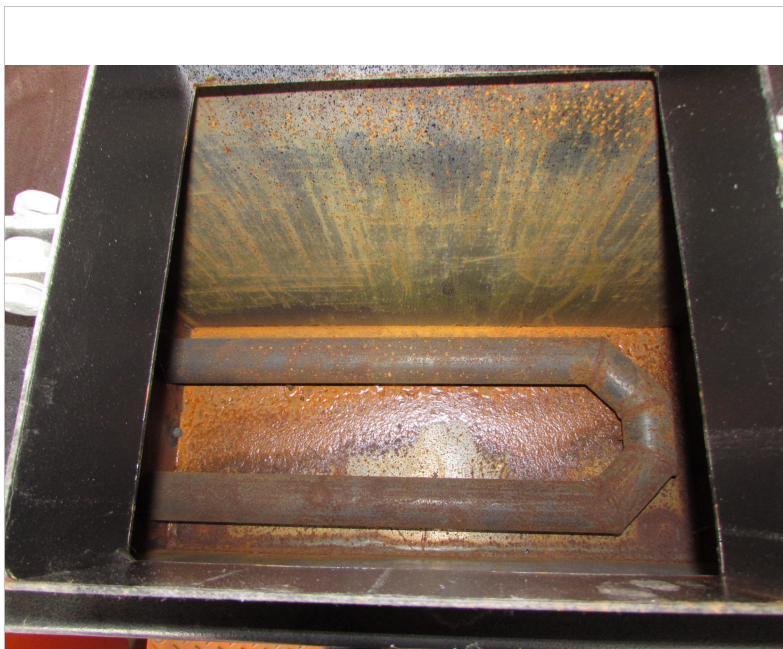
IMG_2729 - wnętrze zbiornika skrapiaczki