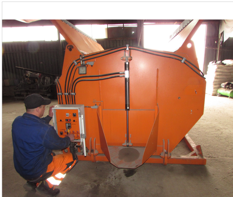
IMG_2815 - osprzet hydrauliczny