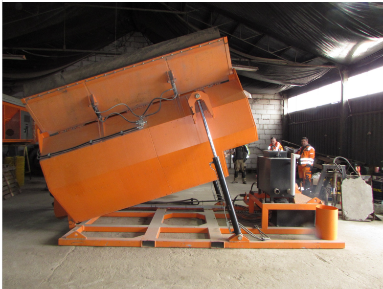
IMG_2679 - stan częściowego odchylenia kapsuły