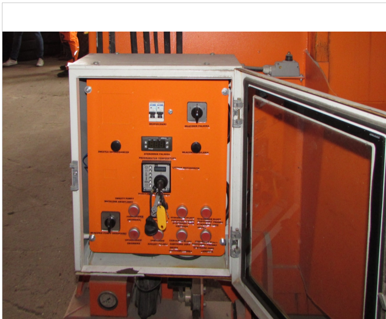
IMG_2655 - widok panelu sterującego