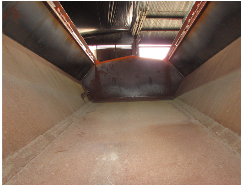
IMG_2651 - widok wnętrza kapsuły