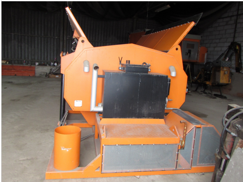
IMG_2660 - stan otwarcia klap wjazdu zasypowego