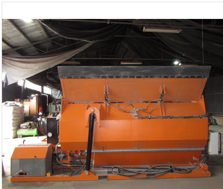
IMG_2661 - ogólny widok termosu