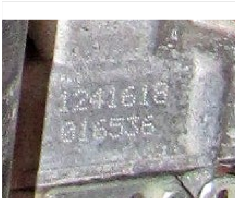
IMG_2710 - silnik spalinowy z osprzętem