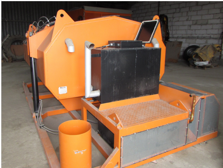
IMG_2741 - ogólny widok termosu